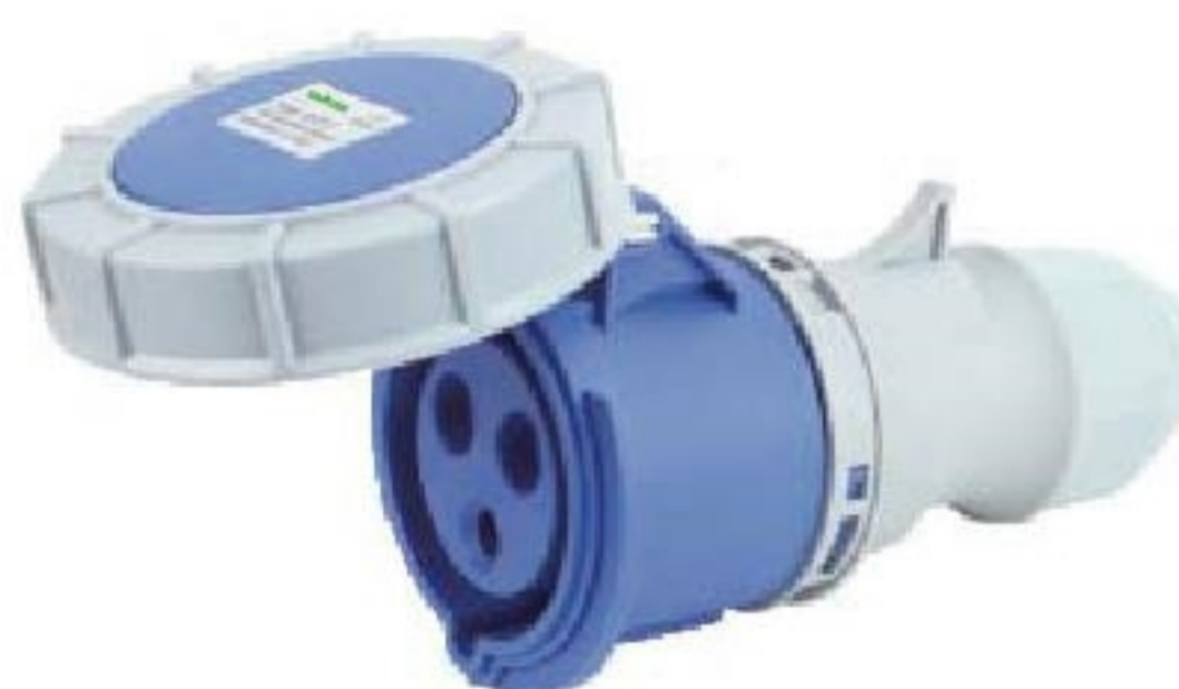
ESO-2132 ESO-2232 corrente(A): 16A, 32A Voltagem(V): 220-240V~