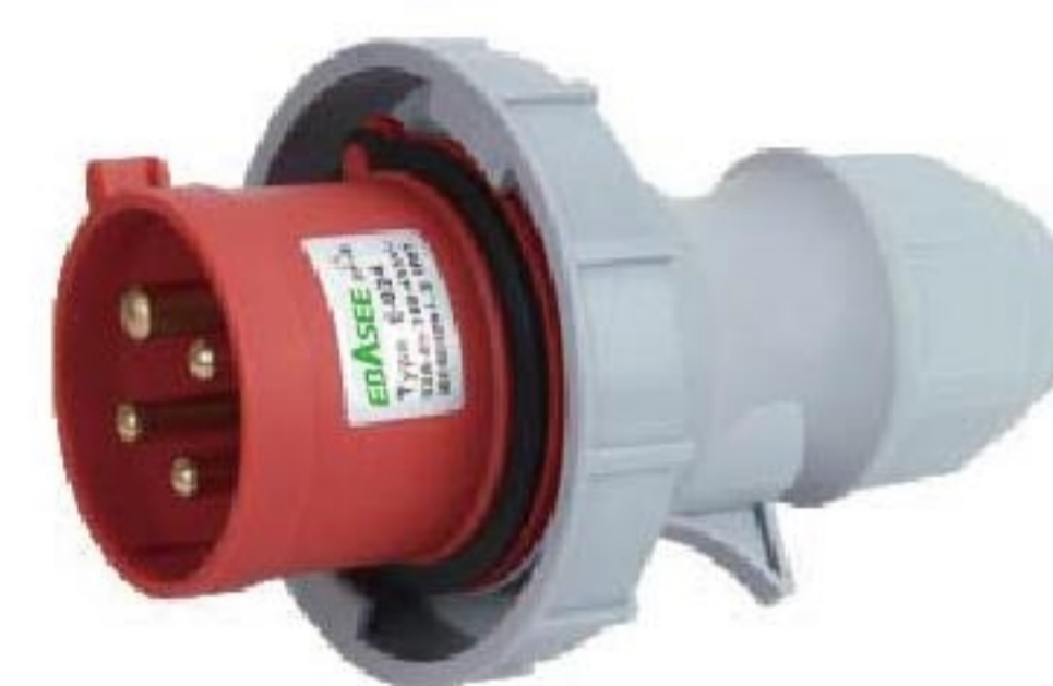
EPL-0142 EPL-0242 corrente(A): 16A, 32A Voltagem(V): 380-415V~