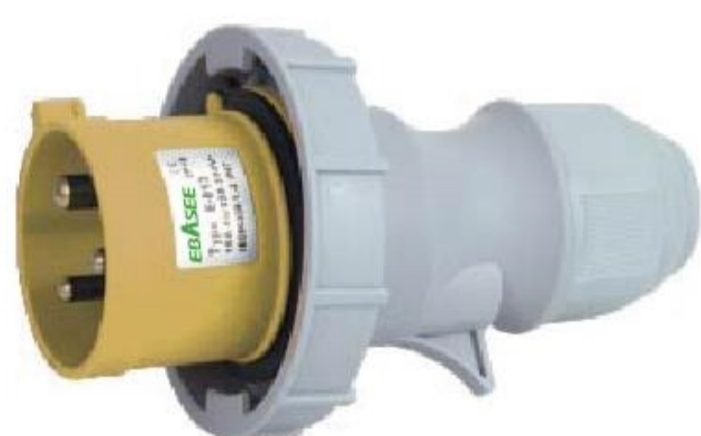
EPL-0132-4 EPL-0232-4 corrente(A): 16A, 32A Voltagem(V): 110-130V~