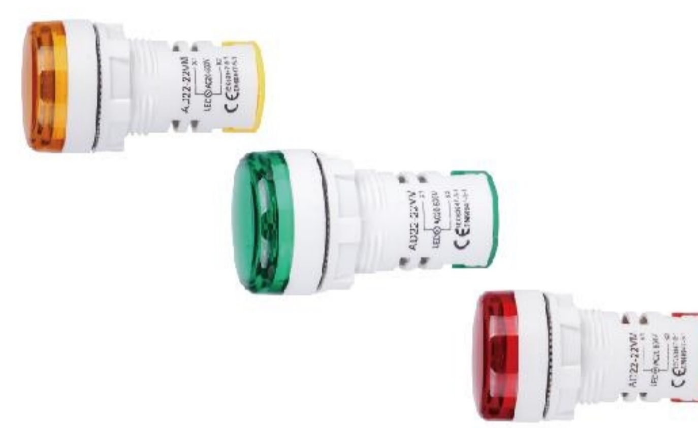
AD22 corrente Voltagem frequência 6/12/24/110/220/380VAC/CC