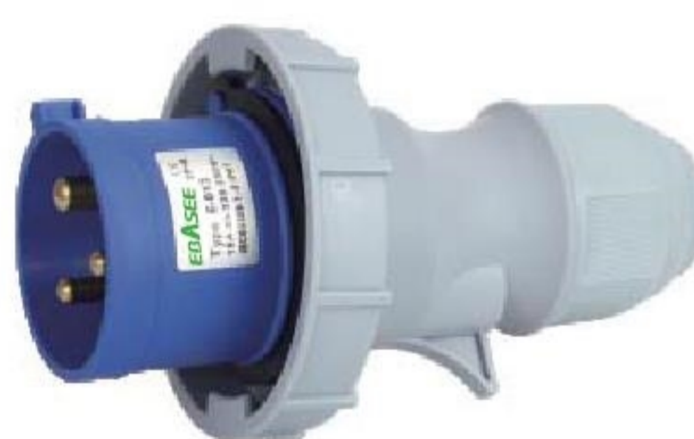
EPL-0132 EPL-0232 corrente(A): 16A, 32A Voltagem(V): 220-240V~