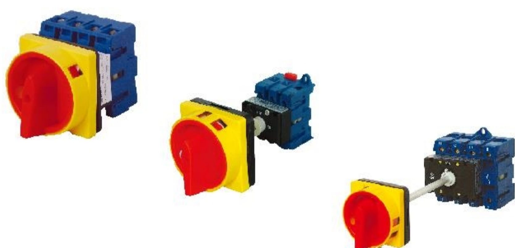
D11 25-100A 150mm eixo disponível IP40 Bloco