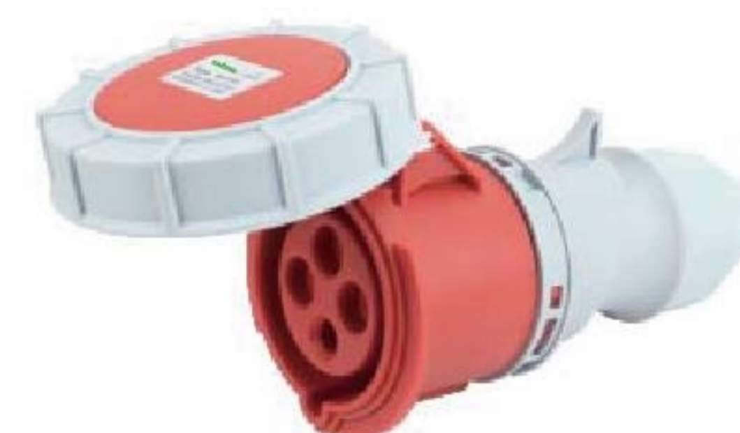
ESO-2142 ESO-2242 corrente(A): 16A, 32A Voltagem(V): 380-415V~