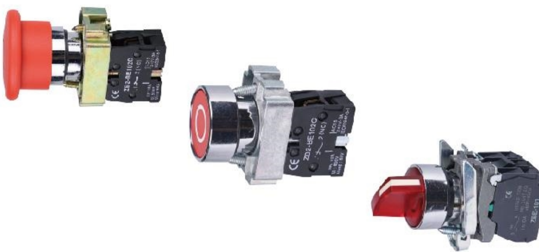
EBSA2 Botão cogumelo de emergência Seletor Botão com luz 6/12/24/110/220/380VAC/CC