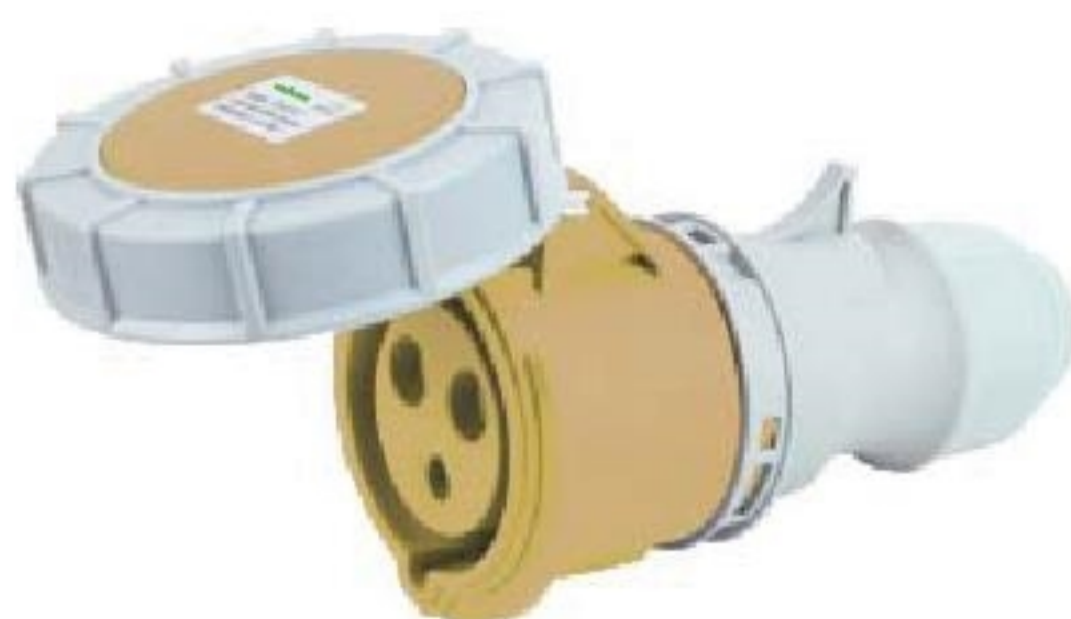
ESO-2132-4 ESO-2232-4 corrente(A): 16A, 32A Voltagem(V): 110-130V~